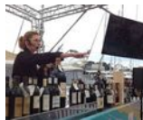
Fête du Millesime 2017