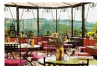
Hostellerie Bérard / La Cadière d'Azur