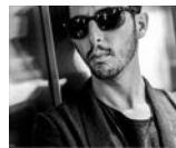
The Avener / Festival Les Aoutiennes 2017