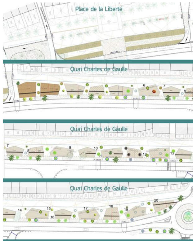
SCHÉMA D'IMPLANTATION DES ARBRES

* Le long de la route : Sophora (arbre à miel), Gleditsia (févier d'amérique), Melia (margousier), Catalpa (arbre aux haricots), Chorisia (arbre bouteille), Robinier. Sur la promenade : Lagerstroemia (lilas des indes), Jacaranda (arbres aux huitres), Tipuana (bois rose), Morus (murier platane), Lagunaria (hibiscus), Schinus (faux poivrier), platane (sur la place) et washingtonia.